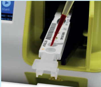
Patientenprobe auf Testkassette aufbringen.